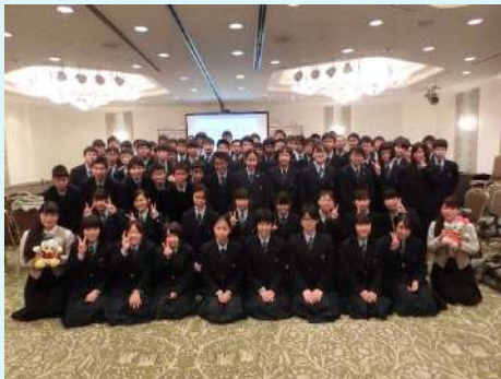
1年ディズニーアカデミー