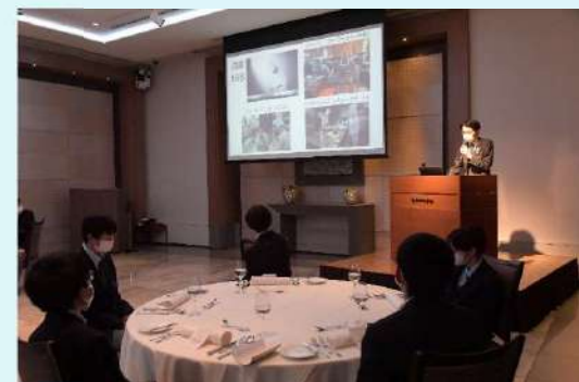
3年テーブルマナー